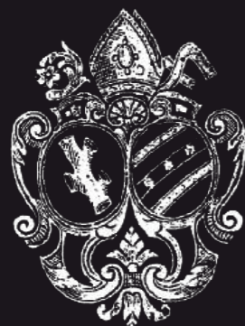
Benediktinské arcidiecéze sv. Vojtěcha a sv. Markéty

We have a long history with the Břevnov Monastery and nobody knows it better.